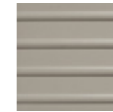
CAUTION LINE CI 20x20 cm LC20 | GE24