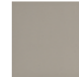
CHANGE OF DIRECTION CI 20x20 cm 1020CI (MD20) | GE16