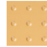
SAFETY LINE CI 20x20 cm LS50 | GE24