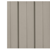
GUIDE LINE CI 20x20 cm LG20 | GE24